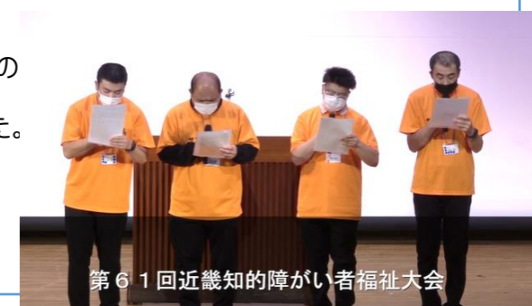
第61回近畿知的障がい者福祉大会