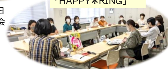
○令和5年10月3日 大和高田市 ○令和6年3月11日 大和郡山市