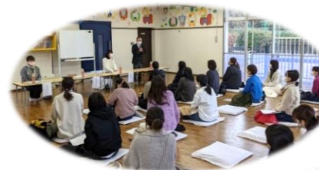
○令和6年1月19日 仔鹿園との交流会