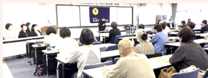
○令和5年6月16日 第36回一般社団法人奈良県手をつなぐ育成会 総会