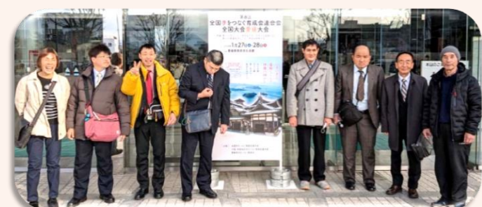
○令和6年1月27・28日 第8回全国大会愛媛大会 奈良県から本人6名と支援者2名、会員3名が参加しました。

地域の小中学校や養護学校にチラシを配布したので 学齢の保護者の参加が多くみられました。