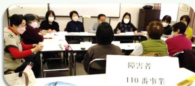
○令和6年1月31日 懇談会「しゃべってみ～ひん」