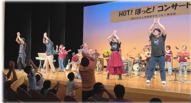
みんな大好きパプリカ♪