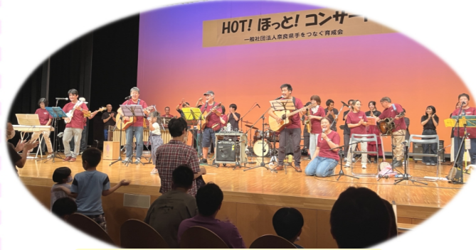
ほんまにもお~校務店の皆さん