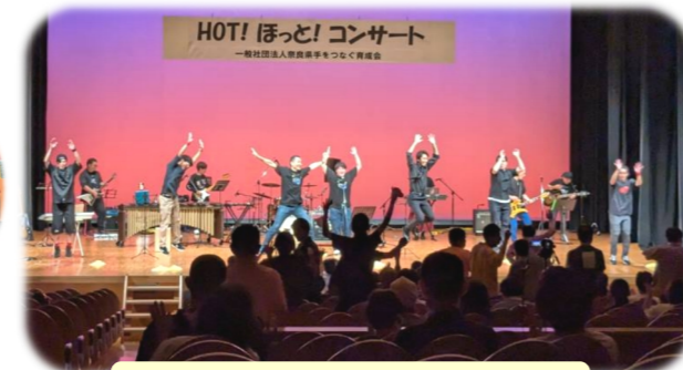
下市町役場バンドの皆さん