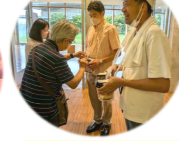
カンパありがとうございました